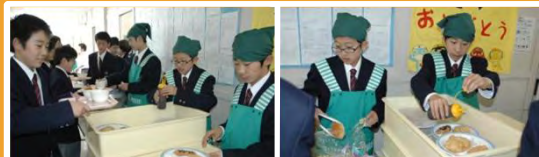
■中学生給食配膳風景