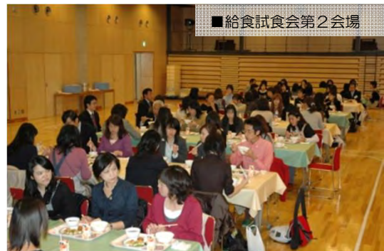
■給食試食会第2会場