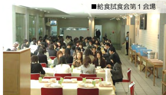
■給食試食会第1会場